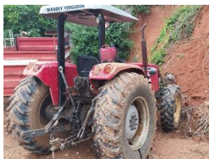
Lote 05 - CARRETA BASCULAR/ EQ. AGRÍCOLA - 2015