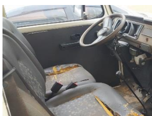
Lote 08 - VW/SAVEIRO CS ST MB - OXI-3024 - 2014/2015